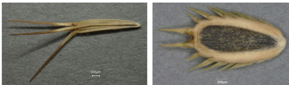
Figure 1. Akènes des fleurons centraux (à gauche) et des fleurons périphériques (à droite) de Synedrella nodiflora — Achenes of Synedrella nodiflora central floret (left) and peripheral floret (right) .

Le portail WIKTROP de partage de connaissances sur les adventices tropicales a permis d'obtenir une description des fruits (capsules, gousses, etc.) et des semences des différentes espèces, de façon à inventorier les caractéristiques des différentes espèces étudiées. Par exemple, Commelina benghalensis L. peut produire des fruits aériens et des fruits souterrains et, dans chaque fruit, produire deux types de semences. Certaines espèces de la famille des Asteraceae ont une inflorescence en capitule constituée de fleurons de formes différentes produisant des semences de formes différentes. C'est le cas par exemple d'espèces comme Bidens pilosa L. et Synedrella nodiflora (L.) Gaertn. ( Figure 1 ).