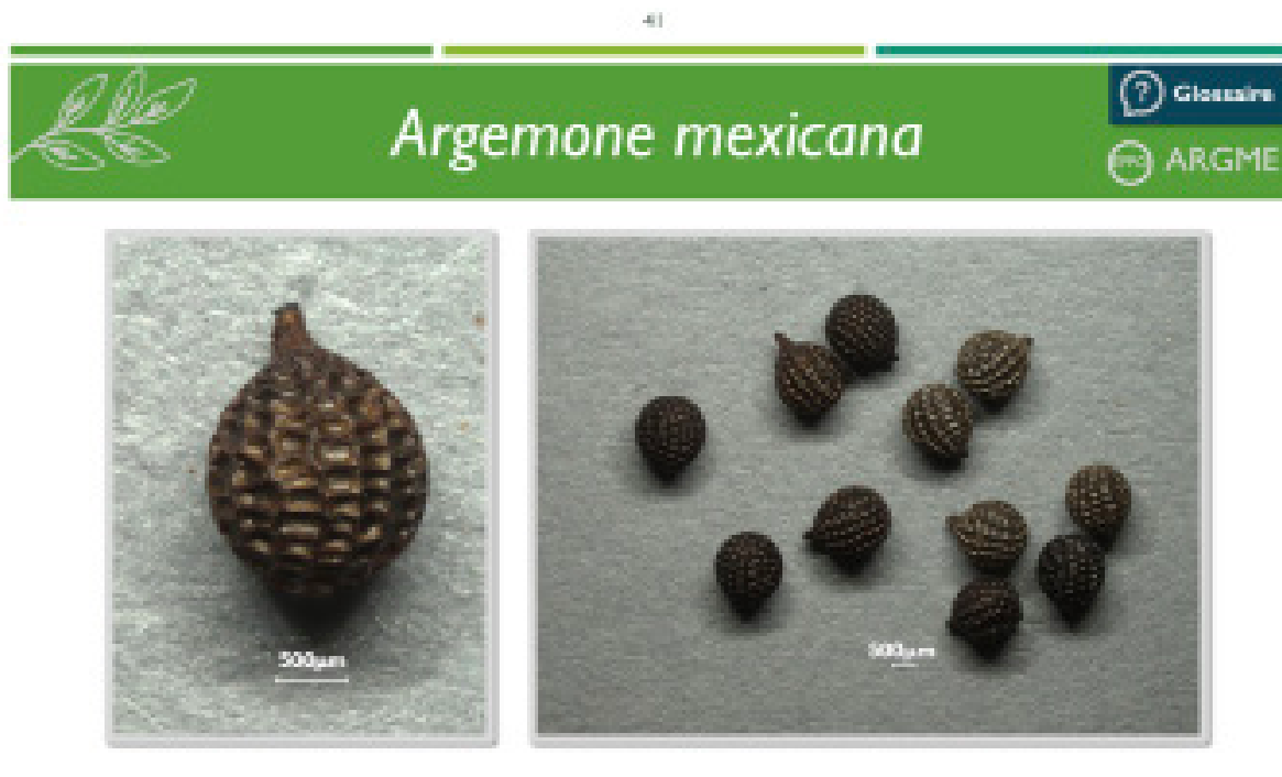
Figure 4. Exemple de la fiche descriptive de la semence d' Argemone mexicana L. (a. première page, b. deuxième page) — Example of the Argemone mexicana L. seed description sheet (a. first page, b. second page).

variable en fonction des sous-groupes constitués. Il est désormais aisé d'intégrer de nouvelles espèces dans cette clé, au fur et à mesure de leur caractérisation, en utilisant les modalités de caractères existantes ou en ajoutant de nouvelles modalités de caractères si nécessaire.