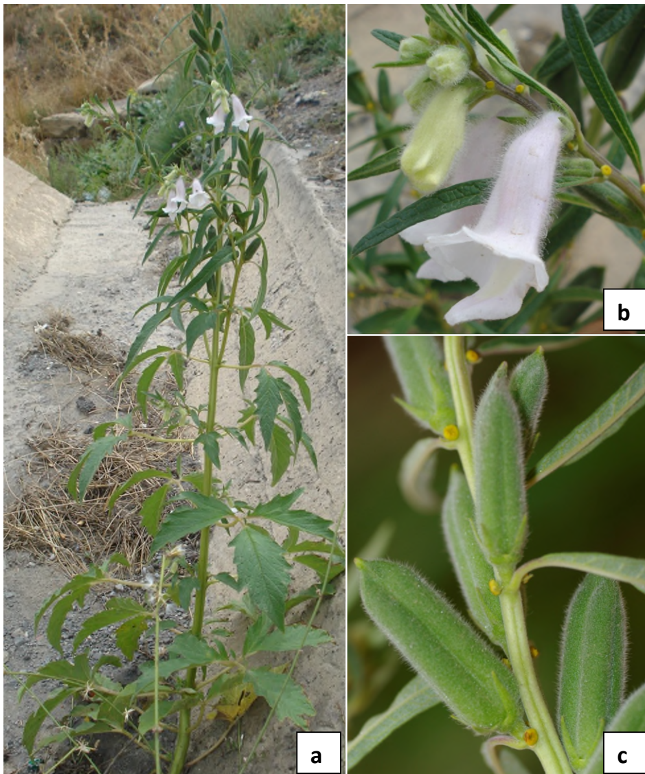
Figure 1 : Illustration de Sesamum indicum L. (a. Plante, b. Fleur, c. Fruit) Bordj Bou Arreridj, 11.09.2018